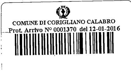
foto collezione in data 12/1/2016 fu eseguita di controfirma nella data di consegna

Al Segretario Generale Comune di Corigliano Calabro